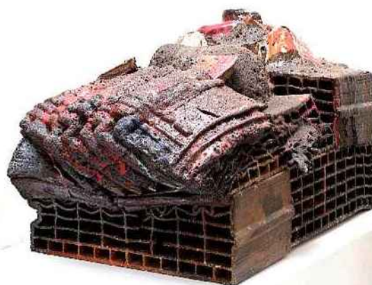
Fabrice Gousset, galerie Loevenbruck

76, rue de Turenne (3 e ); 01-42-16-79-79.