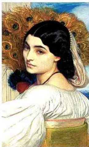
« Pavonia », de Frederic Leighton (1858).

Musée d'Orsay Jusqu'au 15/1/2012. Architecture, littérature, arts