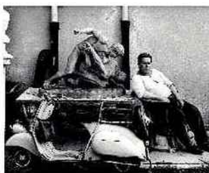
« Rome, Cinecittà », 1956.

Lorsqu'elles furent publiées, à la fin, des années 1950, ces photos de la Ville éternelle prises par William Klein créèrent un choc visuel et esthétique. Le temps n'y a rien fait :