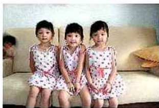
Minstrel Kuik, musée du quai Branly, Photoquai 2011

Des images du monde entier ! Créée en 2007, Photoquai affirme de