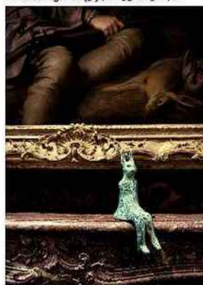
« Lapin témoin », céramique, 2009.

Elles ne laissent jamais indifférent, ces expos qui convient des artistes contemporains à investir les salles du musée de la Chasse et de la Nature. Vidéos, dessins, céramiques, peintures et estampes de Françoise Pérovitch seront ici à découvrir dans des endroits parfois inattendus (dans certains tiroirs, nous dit-on !). 62, rue des Archives, hôtel de Guénégaud (3 e ); 01-53-01-92-40.