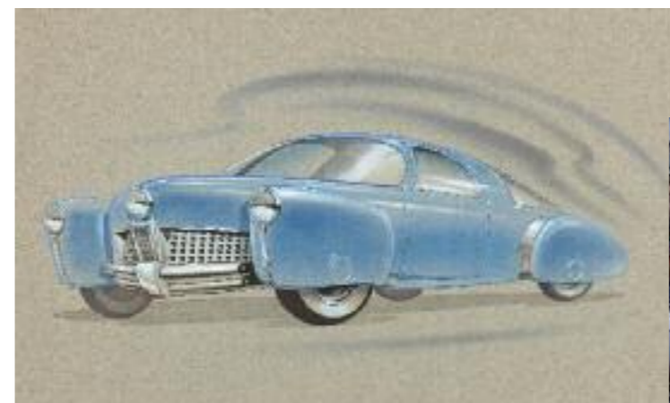
JEFF BRIDGES in 'TUCKER'