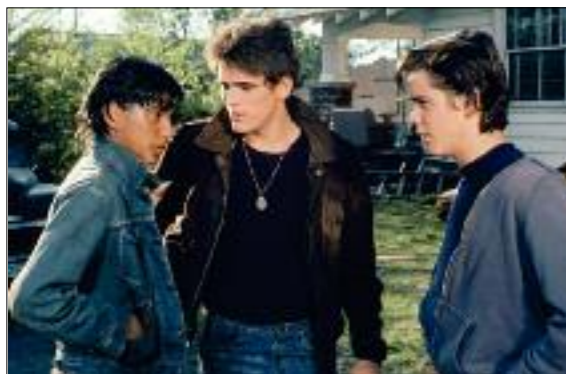
RALPH MACCHIO, MATT DILLON en C. THOMAS HOWELL in THE OUTSIDERS