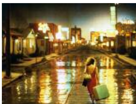
'ONE FROM THE HEART'