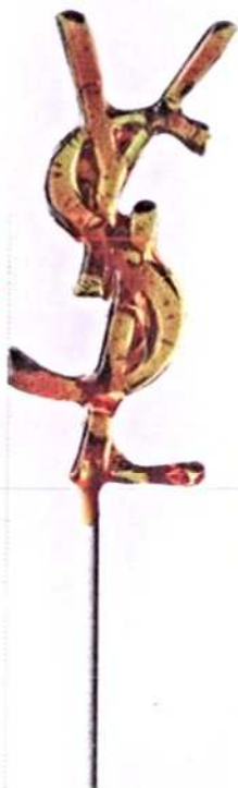
圖文：中區書 攝：中區書 \ MAXXI \ Massimo Gammacurta