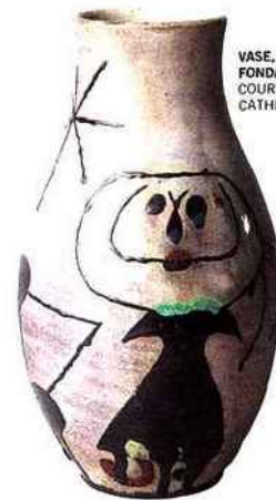
VASE, VERS 1946, COLLABORATION FONDATION ARTIGAS/JOAN MIRÓ.