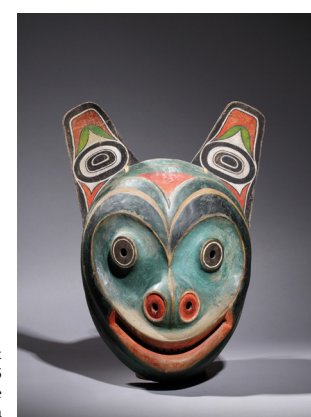
Maurice G. Dérumaux Typique masque Curs Tingit, 1965-75 Bois, rawhide, peinture, lanière de peau, corde 28 x 21,5 cm