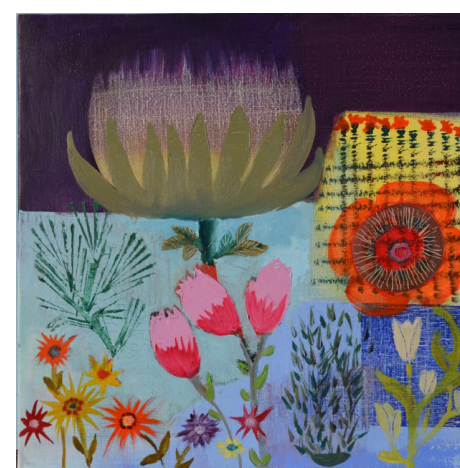
Catherine Starkman Vous avez dit Fleur?, 2014 Huile sur toile 40 x 40 cm