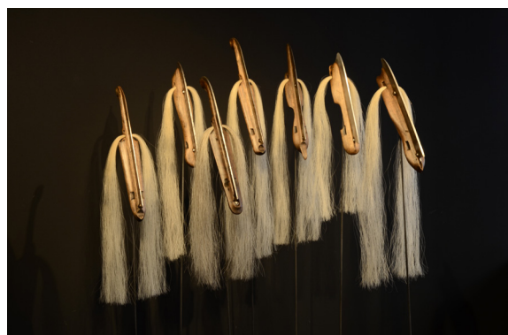
Gilles T. Lacombe Les Inous, 2014 Acier, bois, mèches d'archets en crin de chevaux mâles de Mongolie Dimensions variables