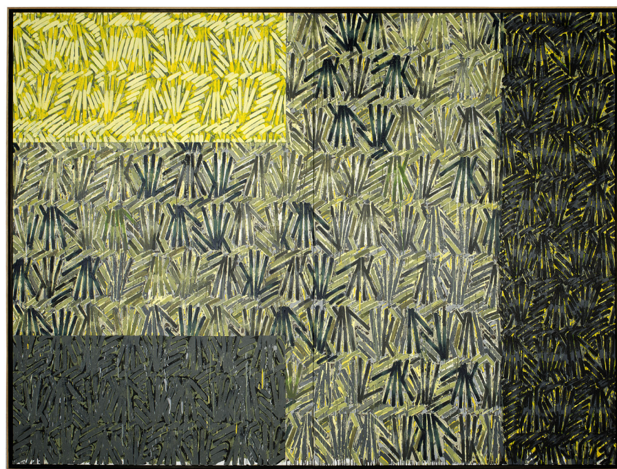
Gérard Titus-Carmel Briée - Sur la route de la Sotie XIII, 2009 Acrylique sur toile 195 x 260 cm