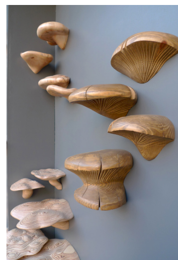
Cyprien Chabert Fistulines, 2012 Bois Dimensions variables