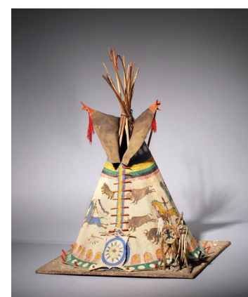
Maurice G. Dérumaux Maquette d'un tipi Blackfoot, Alberta (Canada), 1960-70 Bois, peau, rawhide, tissu, peinture, sable, fil 36,5 x 26 cm