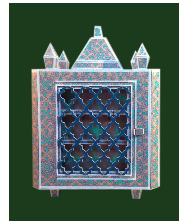
Jimmy Richer Les pièces-maillles, 2014 Serigraphie, carton, tesa 35 x 40 x 35 cm