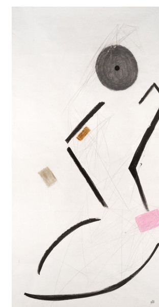
Jean Ardoise The Pink Lady, 2014 Techniques mixtes sur papier 120 x 90 cm