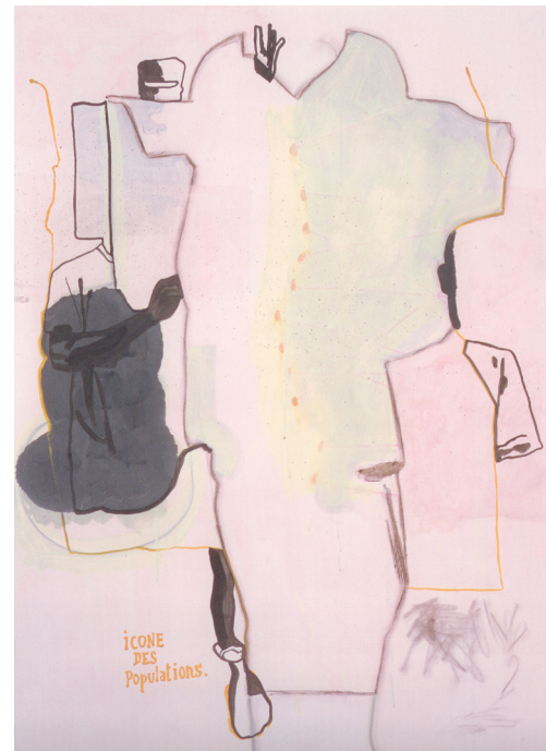
Jean-Michel Alberola Fête des populations, 2003 Cousche sur papier 120 x 80 cm Reproduit dans «Le seul état de mes idées», Jean-Michel Alberola, éditions Erme, 2006