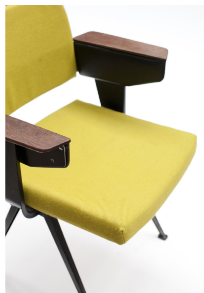
Friso Kramer Fataal Eenzet, 1960, Abroad Tissu, wenghe et bôle d'acier 83 x 63 x 67 cm