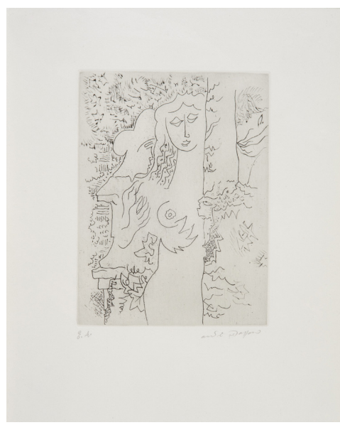
André Masson Pointe-à-chêne signée et mentionnée «EA» Atelier Piero Crommelynck 35 x 43,5 cm

24 mars - 25 avril 2015 Vernissage mardi 24 mars 2015 16h - 21h