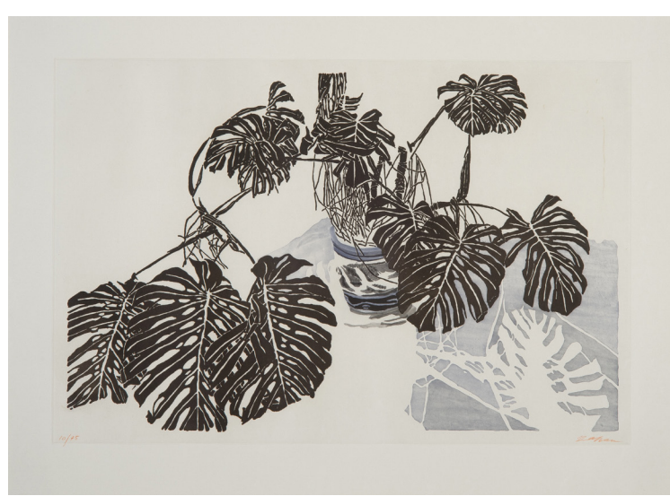
Sam Szafran Aquatinte en couleurs, réhaussée à la main sur papier de Chine Signé et numérotée Atelier Piero Crommelynck 65 x 96,5 cm

Alexandre Bour réalise des sculptures en fils métalliques, véritables installations de lumières jouant sur les ombres portées, comme transparentes et néanmoins étonnamment habitées. Alexandre Bour pense la sculpture en termes de structure, la production de ses croquis en volume demande un travail complexe de projection passant par l'influence réciproque de la technique et du dessin envisagé.