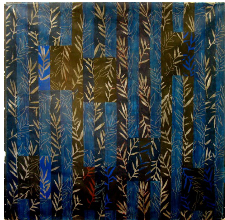
Jean-Michel Meurice Fatales, 1990 Acrylique sur toile 200 x 200 cm