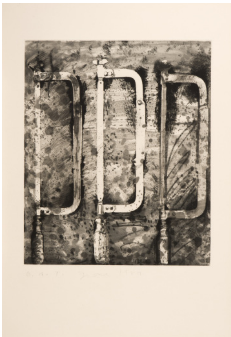
The New French Tools, 1984 Eau-forte, aquatinte et pointe sèche, signée, datée et mentionnée «BAT» Atelier A. et P. Crommelynck

http://www.catherinehouard.com/piero-crommelynck-graveur