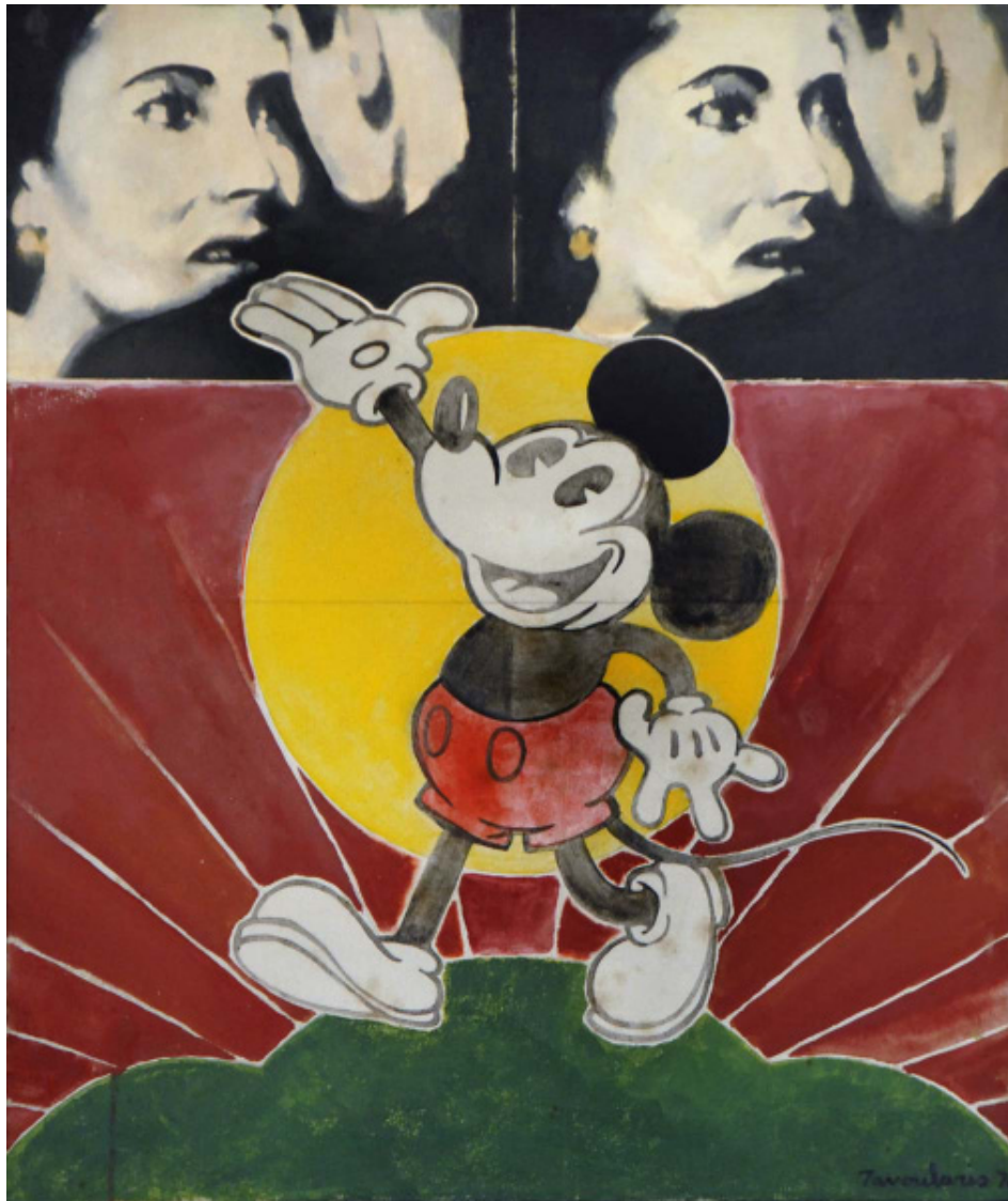
Sans titre, 1970 Acrylique sur toile 51 x 61 cm

http://www.catherinehouard.com/dean-tavoularis