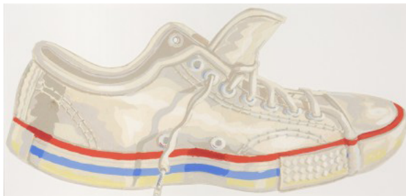
Sneaker cut-out , 1978 Gouache sur carton 22,5 x 47,5 cm