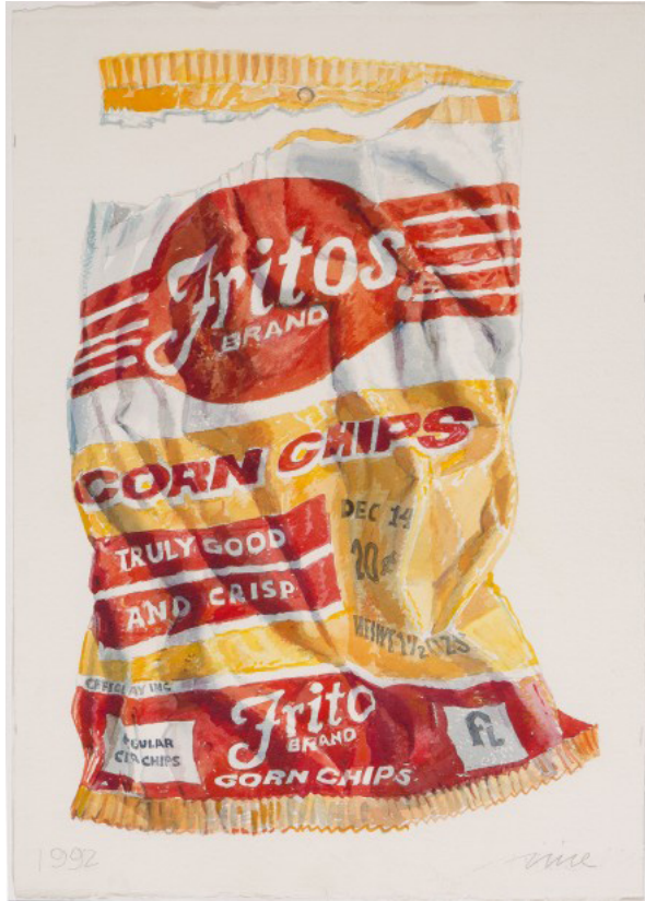
Fritos , 1992 Aquarelle 40 x 55 cm