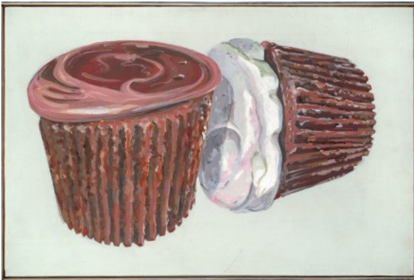
Cupcakes, 1963 Huile sur toile 30,4 x 45,7 cm

http://www.catherinehouard.com/don-nice-pop-paradise