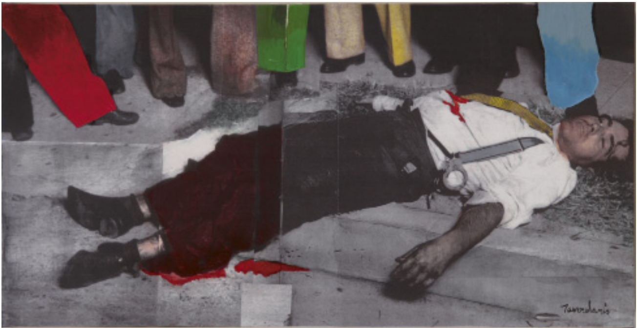
Dead man in the street, 2007 Acrylique et photographie sur toile sensibilisée 109 x 55,5 cm