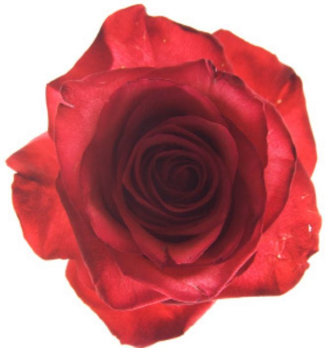
The Hilton Brothers Ten , 2007 91,4 x 121,9 cm