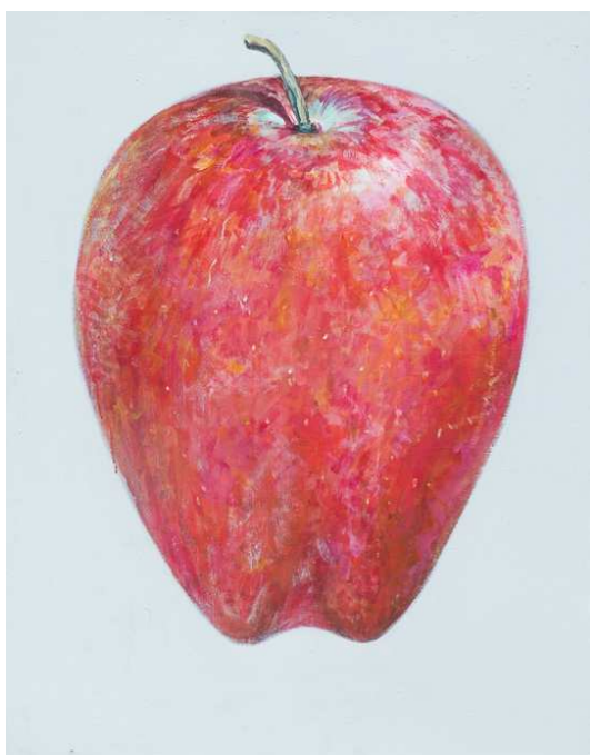
Don Nice, Apple II , 1963 Huile sur toile 95,5 x 76,2 cm