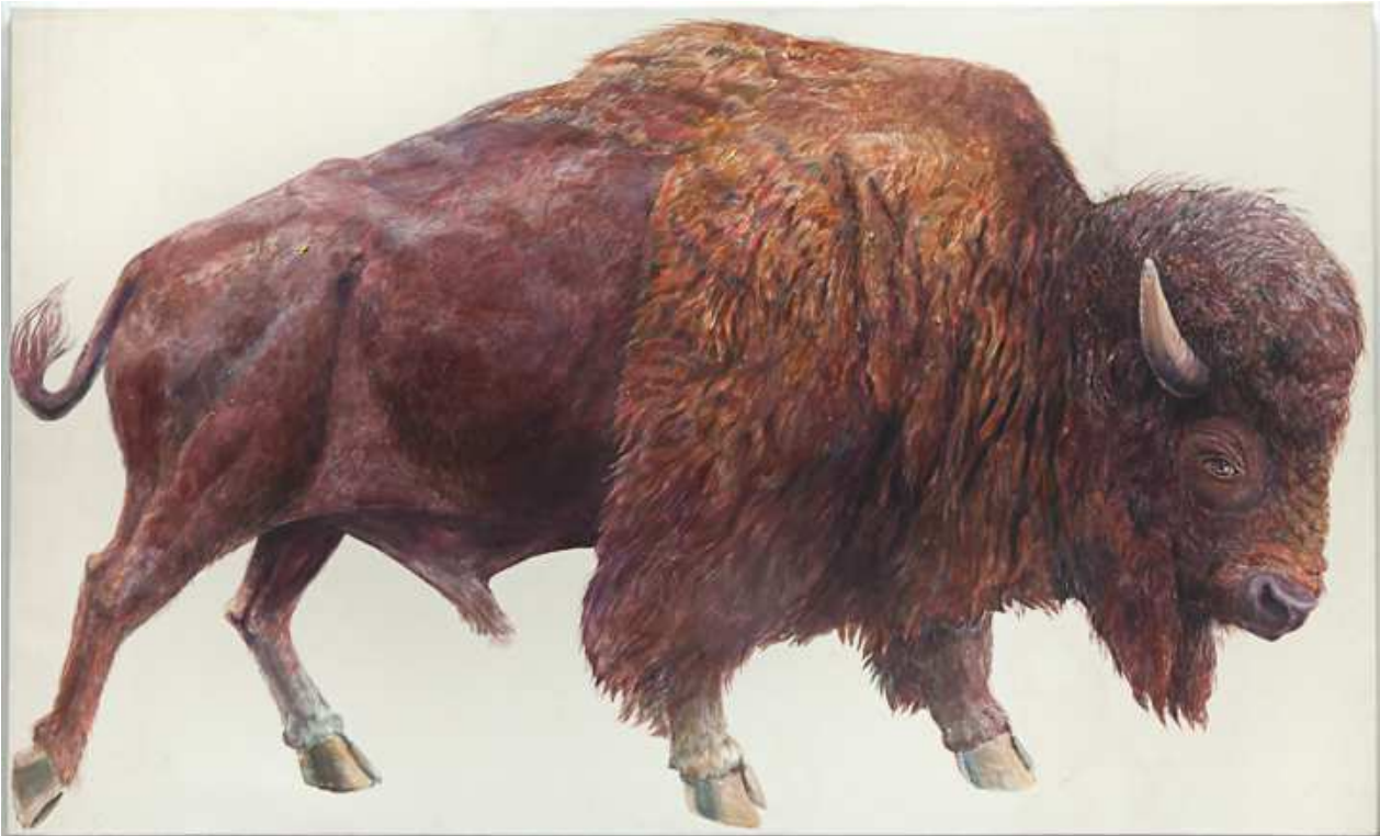
Don Nice, Bison , 1973 Acrylique sur toile 172,7 x 284,4 cm