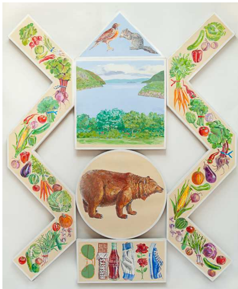
Don Nice , Zigzag Cornucopia , 1981 Huile sur toile 271,7 x 223,5 cm