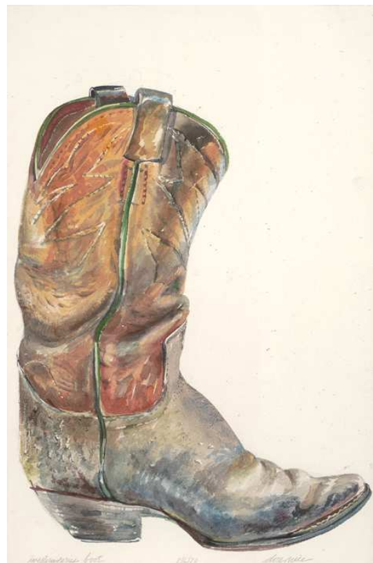
Don Nice, Western Series Boot, 1970 Aquarelle 50,8 x 33 cm