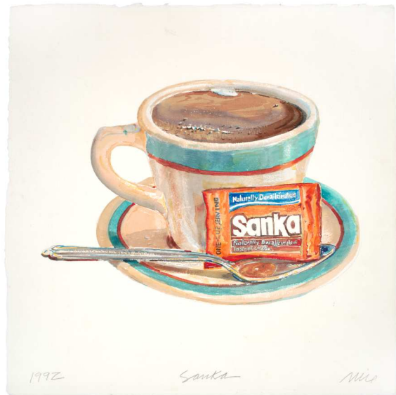
Don Nice, Sanka, 1992 Aquarelle 58,4 x 58,4 cm