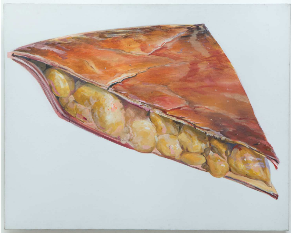
Don Nice , American Pie , 1968 Acrylique sur toile 78,7 x 99 cm