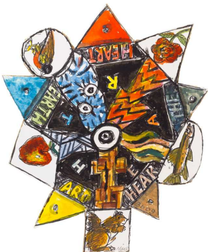
Don Nice, Earth Spinner 3.6.09, 2009 Aquarelle 33 x 33 cm

Metropolitan Museum, New York, USA. Miami University Art Museum, Oxford, USA. Minneapolis Institute of Art, Minneapolis, USA. Museum of Modern Art, New York, USA. National Academy Museum, New York, USA. National Museum of Art, Canberra, Australie. National Resources Defense Council, New York, USA. New York Historical Society, New York, USA. Northern Engraving Corporation, Sparta, USA. Northwest Pipeline Company, Salt Lake City, USA. Ohio Citizens Bank, Toledo, USA. Owens Corning Fiberglass, Toledo, USA. Palmer Museum of Art, Pennsylvania State University, University Park, USA. Pennsylvania Academy of the Arts, Philadelphia, USA. Prudential Insurance Company of America, Houston, USA. Santa Fe College, Santa Fe, USA. Slusser Gallery, University of Michigan, Ann Arbor, USA. Southeast Banking Corporation, Miami, USA. Smith Barney, New York, USA. Science Museum of Minnesota, St. Paul, USA. Springfield Museum of Art, Springfield, USA. Transamerica Corporation, San Francisco, USA. Trust for Public Lands, New York, USA. University of Oklahoma, Norman, USA. University of Sydney, Australie. Walker Art Center, Minneapolis, USA. Whitney Museum of American Art, New York, USA. Yale University Art Gallery, New Haven, USA.