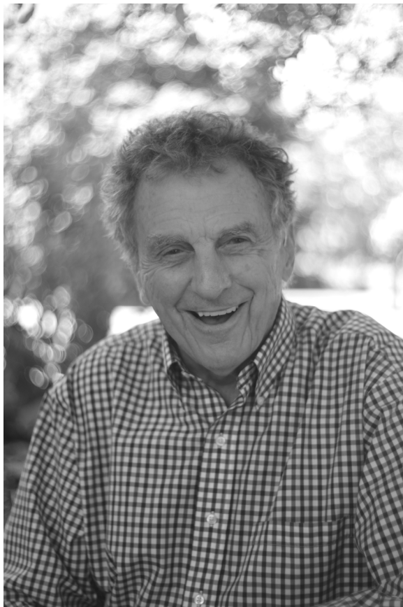
Don Nice by Gregory Selch, 2013 Courtesy Galerie Catherine Houard

Dans la première génération du Pop , on distingue les peintures de Don Nice (né en 1932) pour leurs motifs sur fond blanc . Il représente tant les emblèmes de la civilisation américaine (baskets, ray-ban, barres chocolatées...) que d'autres motifs à la signification plus symbolique (pommes, grappes de raisin...) qui sont de parfaites icônes pop par l'échelle, la couleur . La rétrospective que lui dédie Catherine Houard présente notamment l'un de ces tableaux historiques, Apple II de 1963, qui répondait en écho vivant et naturel aux boîtes de Soupe Campbell de Warhol (1962).