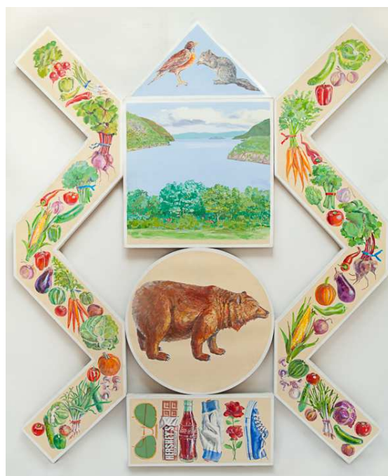
Don Nice, Zigzag Cornucopia , 1981 Huile sur toile 271,7 x 223,5 cm

Catherine Houard présente la première exposition à Paris consacrée à l'un des artistes majeurs du Pop Art et du Réalisme américain, Don Nice.