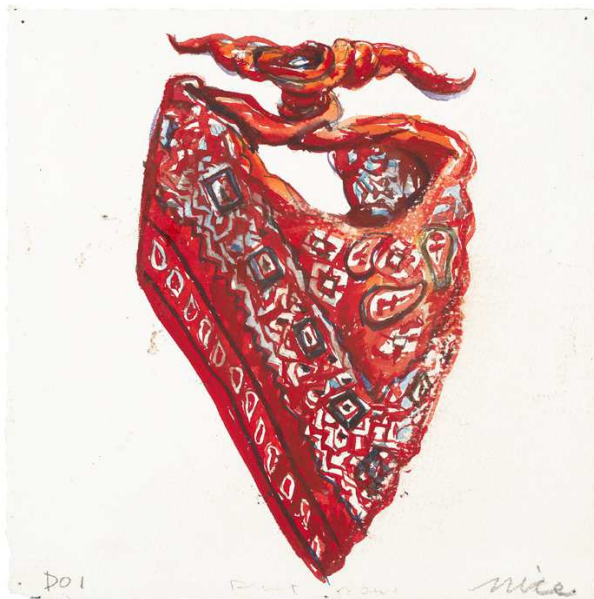
Don Nice, Bandana, 1994 Aquarelle 20,3 x 20,3 cm