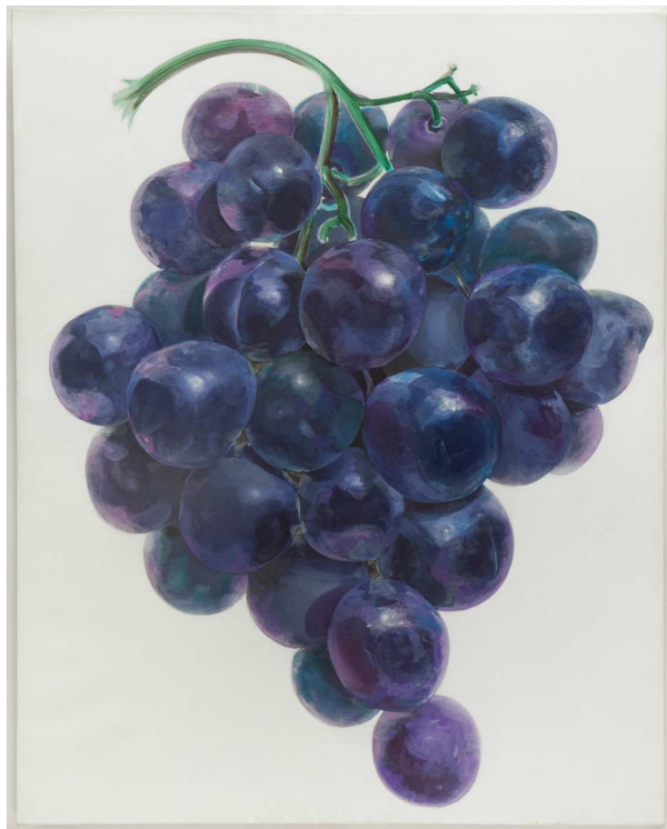
Don Nice, Purple Grapes , 1967 Acrylique sur toile 152,4 x 101,6 cm