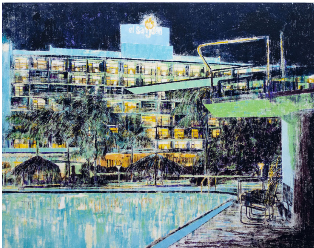
Enoc Perez , Hotel San Juan, Isla Verde, Puerto Rico , 2004, huile sur toile, 182,9 x 228,6 cm

Après l'exposition du designer Friso Kramer, la Galerie Catherine Houard présente du 13 mars au 18 mai 2013, une exposition de l'artiste portoricain Enoc Perez .