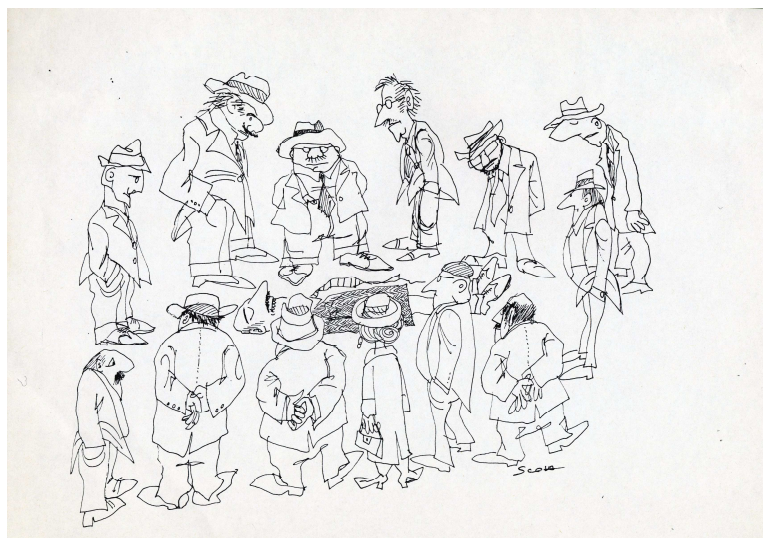
Sans titre, dessin original à l'encre de chine, non daté, signé.

Ettore Scola recevra le Prix SACD 2012 pour l'ensemble de son œuvre en juin à Paris. A l'occasion de la conférence de presse du Festival Paris Cinéma (qui fêtera sa 10 e édition cette année), Bertrand Delanoë, Maire de Paris, remettra en premier lieu, la Grande Médaille de Vermeil de la Ville à Ettore Scola. Une projection exceptionnelle d' "Une journée particulière" (1977) sera organisée le samedi 9 juin 2012 à la Cinémathèque Française suivie d'un dialogue entre Ettore Scola et Serge Toubiana.