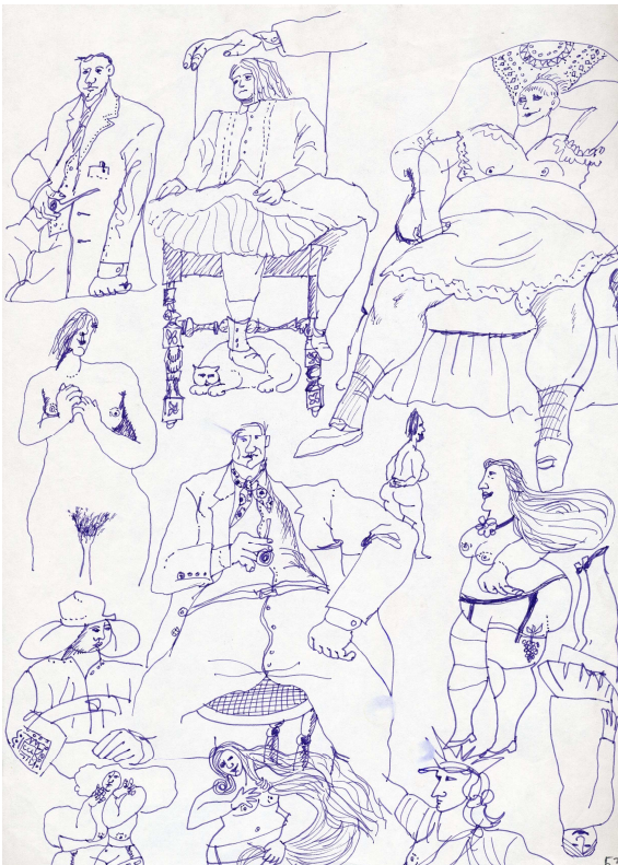
Sans titre, dessin original à l'encre de chine, non daté, signé.