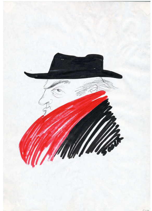
Portrait de Fellini, dessin original à l'encre de chine et feutres, non daté, signé.

Ettore Scola n'exerce pas seulement son art de l'observation caméra en main. Avant d'être réalisateur, Scola a été caricaturiste au journal satirique Italien "Marc'Aurelio", viviers des futurs monstres du grand cinéma italien dont Fellini. Scola en a gardé un art du trait incisif, provocateur et plein d'humour . Il croque ses contemporains d'un trait fin et précis, avec ses personnages obèses ou filiformes, ses situations tragi-comiques, et son sens poétique de l'absurde.