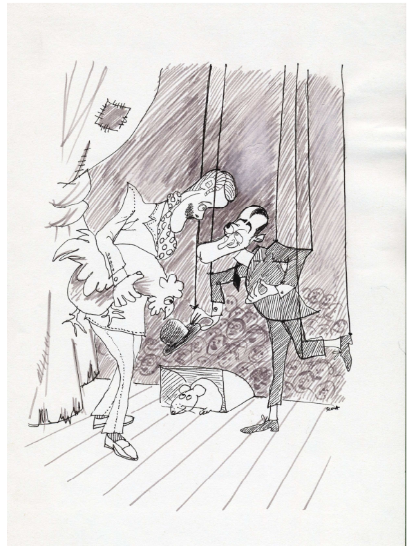
Sans titre, dessin original à l'encre de chine, non daté, signé.