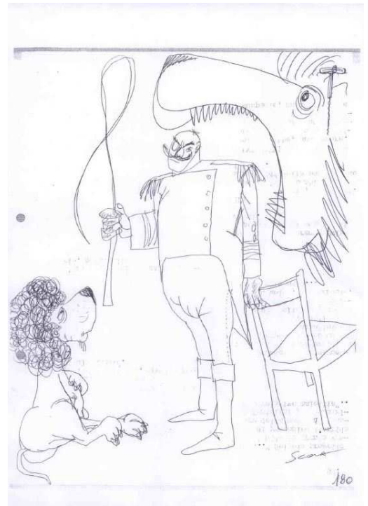
Sans titre, dessin original à l'encre de chine, non daté, signé.