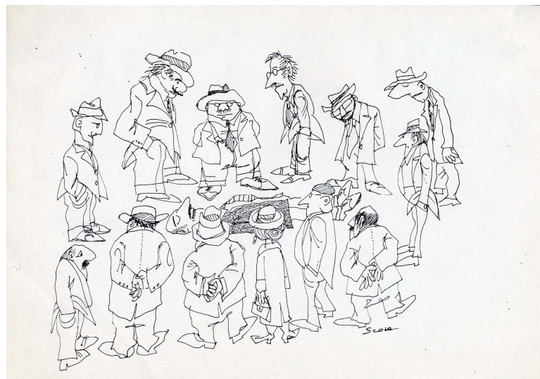
Sans titre, dessin original à l'encre de chine, non daté, signé.

Ettore Scola sarà insignito dal Premio SACD 2012 per la sua opera in giugno a Parigi. Una proiezione eccezionale di " Una giornata particolare " (1977) sarà organizzata sabato 9 giugno 2012 alla Cinémathèque Française seguita da un dialogo tra Ettore Scola e Serge Toubiana.