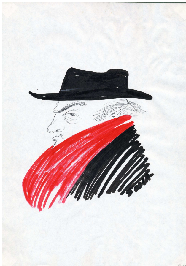
Portrait de Fellini , dessin original à l'encre de chine et feutres, non daté, signé.

Ma in Ettore Scola, l'arte nell'osservare non è solo cinematografico. Prima di diventare regista, Scola fu caricaturista al giornale satirico « Marc'Aurelio », vivaio di futuri mostri del grande cinema italiano fra cui Fellini. In Scola ne è rimasto l'arte del tratto incisivo, provocatorio e profondamente umoristico. Gli schizzi sui suoi contemporanei hanno un tratto fine e preciso, con i suoi personaggi obesi o filiformi, le sue situazioni d'ispirazione tragico-comica, ed il suo senso poetico dell'assurdo.