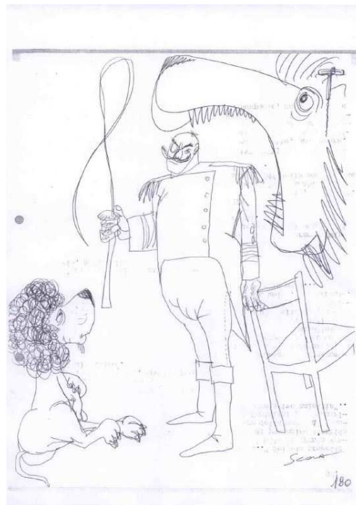
Sans titre, dessin original à l'encre de chine, non daté, signé.