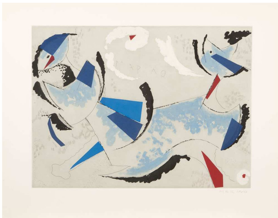
Marino Marini , gravure signée et numérotée, 52.2x 67.4 cm.

Art Paris Grand Palais 29 mars - 1 avril 2012