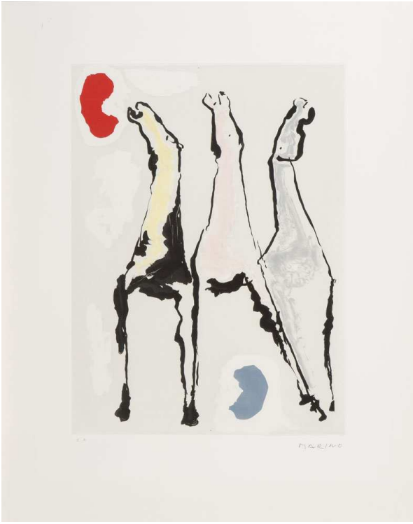
Marino Marini , Tre cavalli , 1977, 59.3x74.2 cm, eau-forte et aquatinte en couleurs, rehaussé à la main, signée et numéroté.