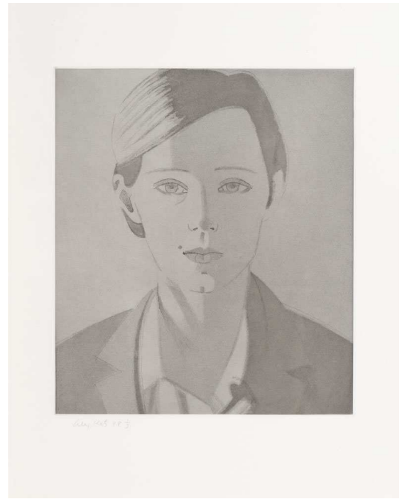
Alex Katz , Portrait de femme , 1988, 41.2x47.7 cm, gravure signée et numérotée.