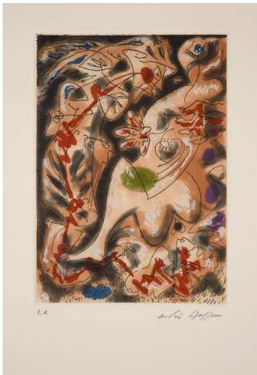
André Masson , Lansquenet et courtisane , 1964, gravure numérotée et signée.

Piero Crommelynck réalisa sa toute première gravure avec André Masson qui travailla avec son ami Piero jusqu'à sa mort.