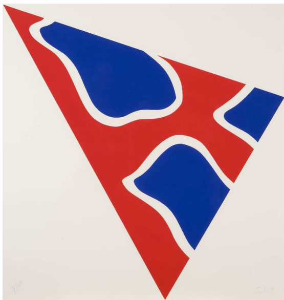
Claude Viallat , Triangle , 1992, 83x87 cm, Aquatinte en couleurs, signée et numérotée.