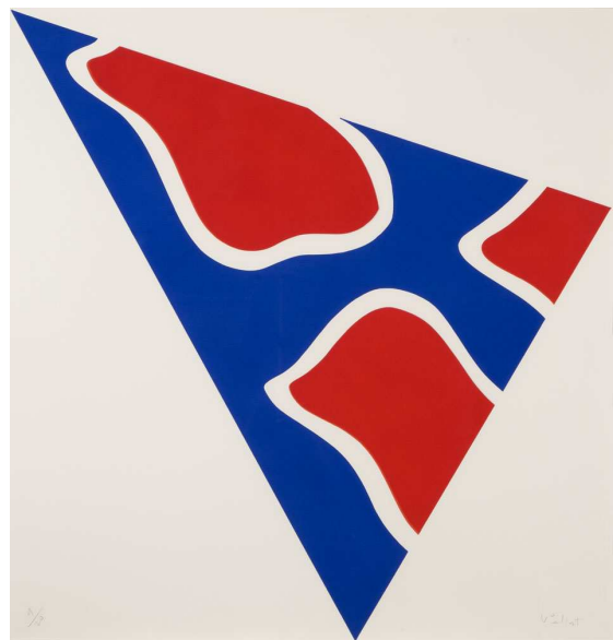
Claude Viallat , Triangle , 1992, 83x87 cm, Aquatinte en couleurs, signée et numérotée.