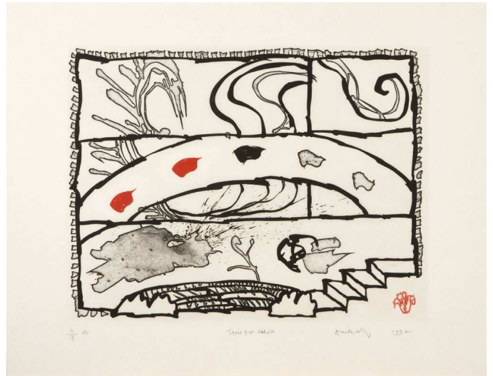
Pierre Alechinsky , Trois pas dehors , 1992, 91.5 x 71.5 cm, gravure signée et numérotée.