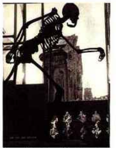
Squelette dans une des salles de la Kunstakademie, Dresde, 1945 Du 18 novembre 2011 au 12 février 2012 Apocalypses, la disparition des villes, de Dresde à Détroit (1944-2010)

10 la Galerie Sit Down accueille la première exposition personnelle de Tom Wood à Paris. Surnommé « Photie Man » (le type à l'appareil photo), cet Irlandais né en 1951, choisit Liverpool comme terre d'adoption. C'est elle qu'il arpente et mitraille depuis 30 ans. Entre documentaire et recherche artistique, son travail participe, à l'instar de Martin Parr ou Chris Killip, « au mouvement de la photographie sociale anglaise qui s'est développée suite à l'explosion punk en réaction aux années Thatcher ». Celui que Martin Parr qualifiait en 1998 de « génie méconnu de la photographie britannique » ne l'est officiellement plus... www.sitdown.fr