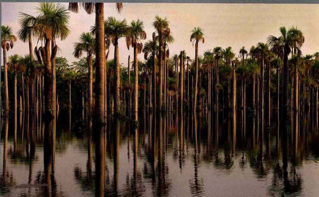
Festival Montier-en-Der