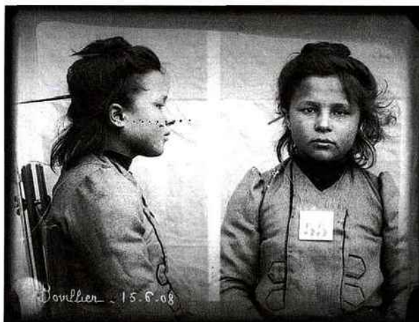
L'une des images issues de l'exposition "Fichés" à voir aux Archives Nationales (Paris 4) jusqu'au 26 décembre.

de s'amplifier. Une récente exposition à Arles de Taryn Simon fait état de la fragilité du système. Elle a photographié, aux USA, à l'endroit même où les meurtres ont été commis, des individus condamnés sur identification photographique, innocentés des années plus tard par des analyses ADN. "Fichés" nous plonge dans l'abîme qu'est la photographie d'identité. En 1967, les services de la police nationale détenaient 130 millions de fiches! Ce qui nous est ici présenté est terrifiant! Toutes ces images figées et accumulées qui nivellent les individus échappent à toute approche esthétique et créent une sorte de vertige. L'entreprise menée dans un premier temps dans un cadre policier, s'est banalisée et a fini par concerner l'ensemble de la population. Daguerre n'avait certainement pas envisagé une telle utilisation de son procédé.