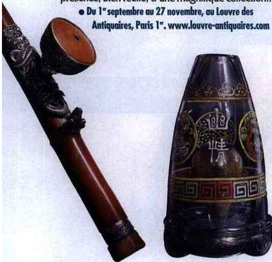
■ Pipe en bambou et argent et lampe en verre peinte d'émaux.

● Du 1 er septembre au 27 novembre, au Louvre des Antiquaires, Paris 1 er . www.louvre-antiquaires.com