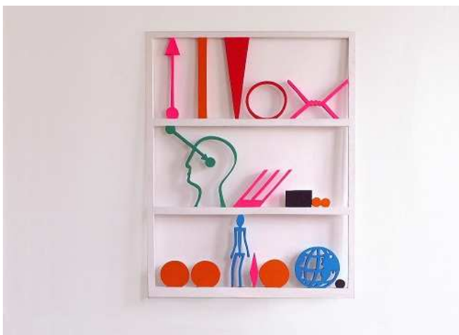
Sculpture, découpage bois polychrome "Maintenant, je veux être aussi compris par tous les hommes de la planète" 2003