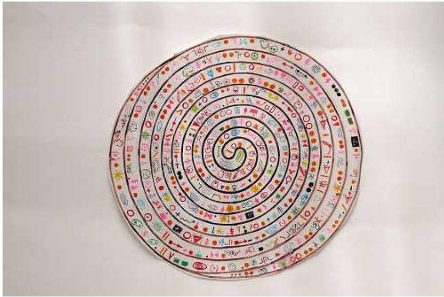
Dessin préparatoire, toile spirale en "Quentin-Babelweb", acrylique sur toile, 2 mètres de diamètre.