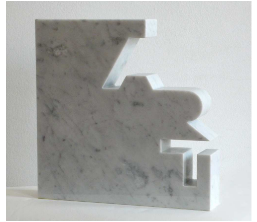
"Art", Marbre, Carrare blanc, multiple, 2010