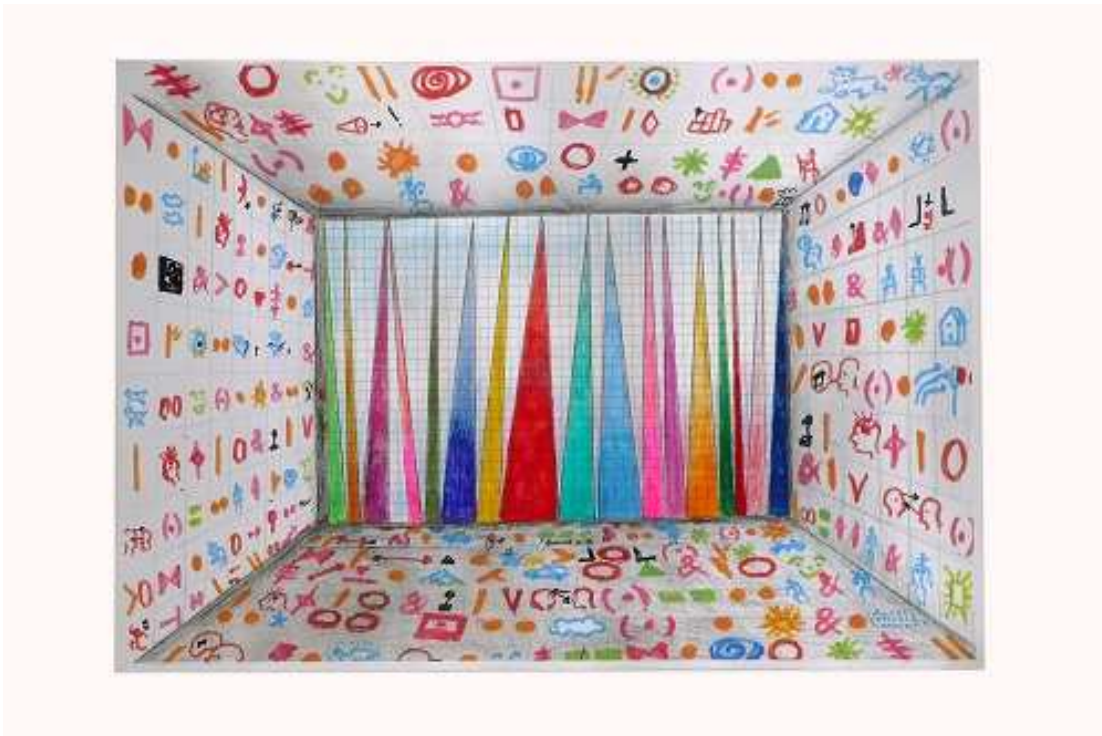
Dessin préparatoire, "Perspective", impression acrylique sur bâche, 2009, 420m x 290m.