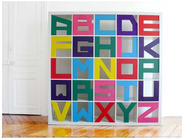
Bibliothèque en bois peint "Alpha - Beta" 1968