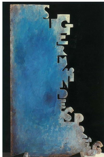
Sculpture "Saint-Germain-des-Prés" bronze, 1993.

A Paris, sa dernière réalisation est un environnement artistique de l'hôtel particulier de Gérard Depardieu où l'acteur, lui aussi perpétuel amoureux des mots et de la poésie, lui a permis de s'exprimer en toute liberté sur de nouveaux supports, façade, cheminées, bas relief, vitraux.