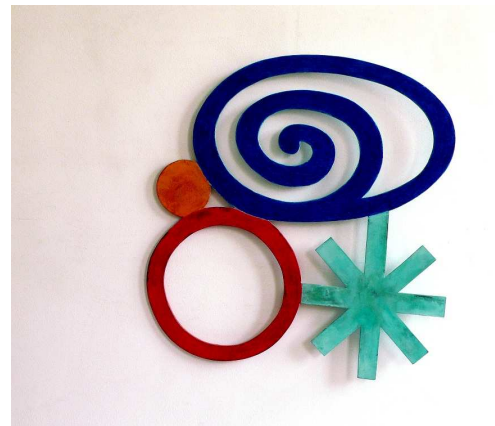
Sculpture découpage bois polychrome " La vie est belle", 2010.