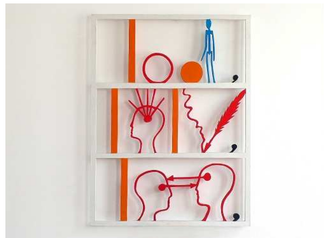
Sculpture, découpage bois polychrome "Je suis un homme, je pense, j'écris, je communique." 2003