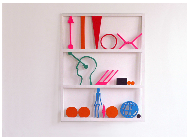
Sculpture, découpage bois polychrome "Maintenant, je veux être aussi compris par tous les hommes de la planète" 2003