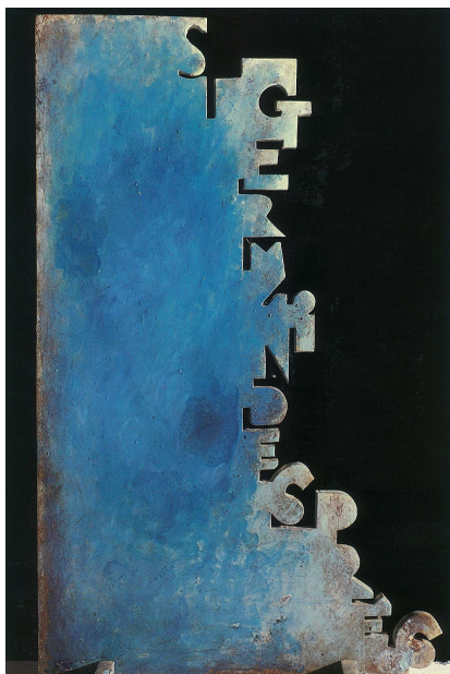
Sculpture "Saint-Germain-des-Prés" bronze, 1993.

A Paris, sa dernière réalisation est un environnement artistique de l'hôtel particulier de Gérard Depardieu où l'acteur, lui aussi perpétuel amoureux des mots et de la poésie, lui a permis de s'exprimer en toute liberté sur de nouveaux supports, façade, cheminées, bas relief, vitraux.