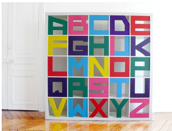
Bibliothèque en bois peint "Alpha - Beta" 1968