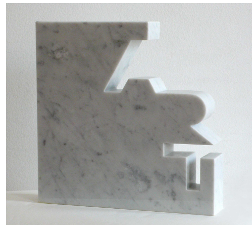
"Art", Marbre, Carrare blanc, multiple, 2010