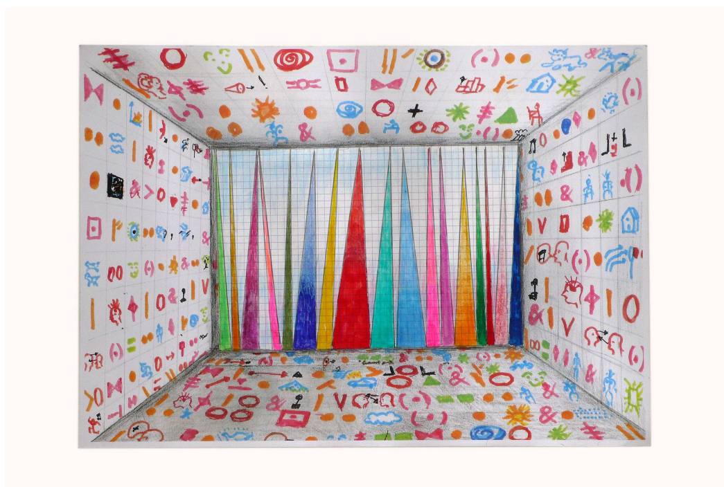
Dessin préparatoire, "Perspective", impression acrylique sur bâche, 2009, 420m x 290m.