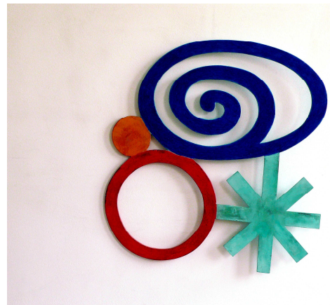
Sculpture découpage bois polychrome " La vie est belle", 2010.