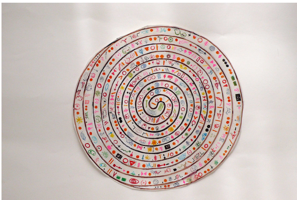
Dessin préparatoire, toile spirale en "Quentin-Babelweb", acrylique sur toile, 2 mètres de diamètre.