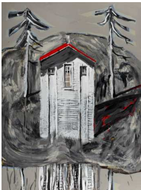
Sans titre, peinture sur toile, 130x97 cm, 2009.