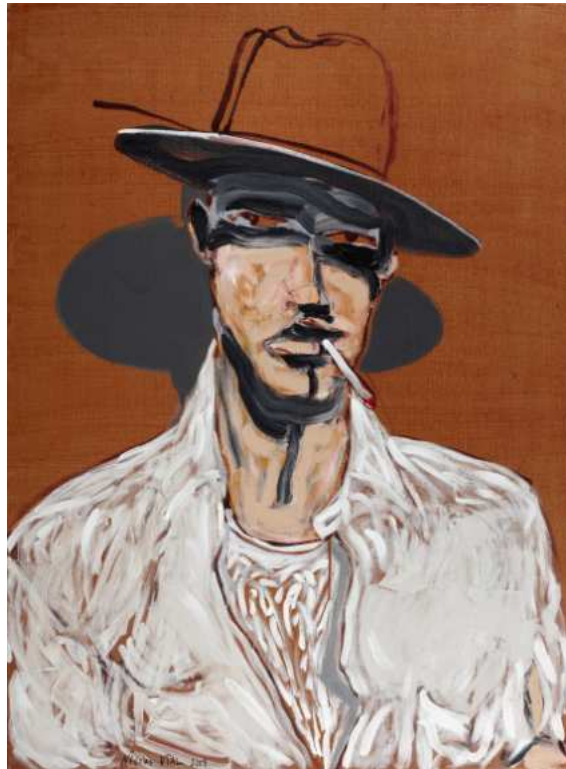
L'homme à la cigarette, peinture sur toile, 130 x 97 cm, 2008.

Le catalogue de l'exposition sera en vente à la galerie.