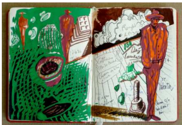
Extrait d' Agenda, 36 x 23,5 cm, Février 2010.