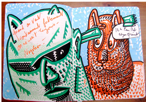
Extrait d' Agenda, 36 x 23,5 cm, Janvier 2008.

Ces dessins, semblables à l'écriture automatique chère aux surréalistes, jetés sur les doubles pages des agendas ont cependant des points communs avec ses tableaux de grands formats, aux matières superposées dont Harry Bellet dit dans Le Monde «...la matière, par exemple, étendue, grattée, étendue à nouveau, crée une stratification réjouissante sans jamais s'empâter ». Une peinture gestuelle donnant une dimension forte à des sujets presque classiques: maisons et portraits d'hommes.